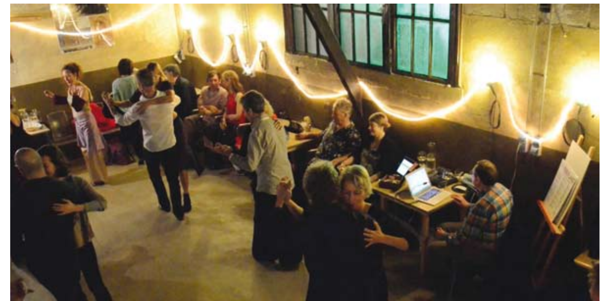
Oberland, een van de locaties van het festival