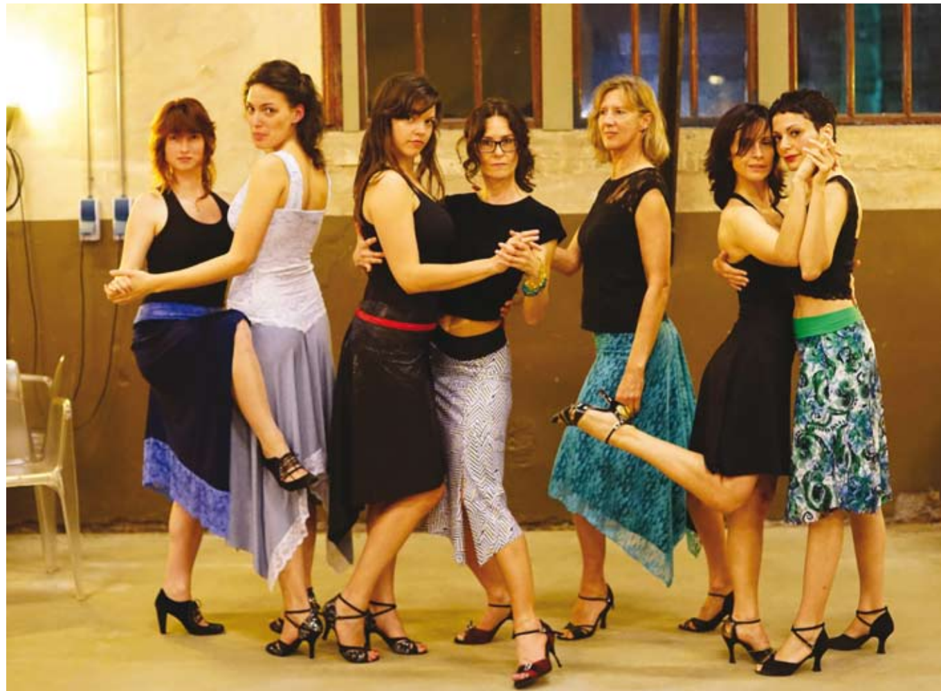
Groningse danseressen showen kleding van Jelena-D